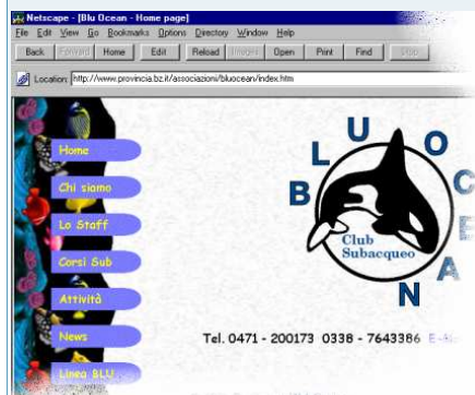
La home page del sito Blu Ocean