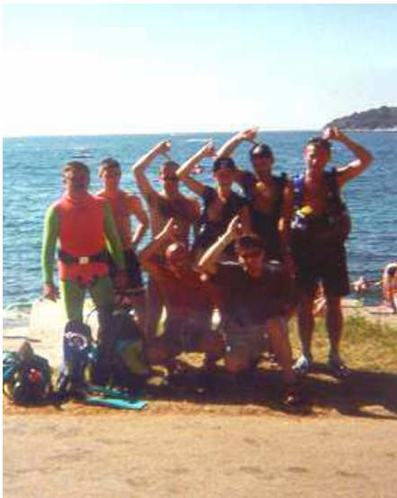
Foto di gruppo a Porèc, Croazia

All'una si va tutti a nanna, con un po' di emozione ed agitazione al pensiero dell'esame in acque libere