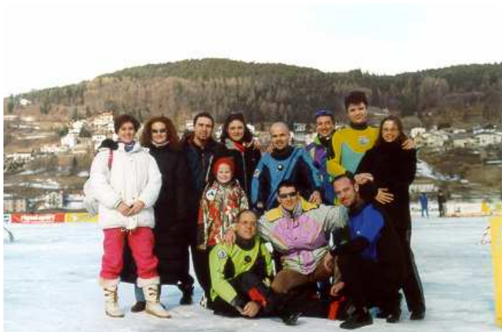
Il gruppo Blu Ocean al Lago della Serrai

Dopo un'anno di assenza, finalmente un gruppo di irriducibili uomini blu, ha sciolto gli indugi (non il ghiaccio) decidendo di partecipare all'annuale stage d'immersione sotto il ghiaccio organizzato da Archeo Sub di Trento nella splendida cornice del Lago della Serrai a a Baselga di Pinè. E così, accompagnati da alcuni soci di supporto, in una giornata